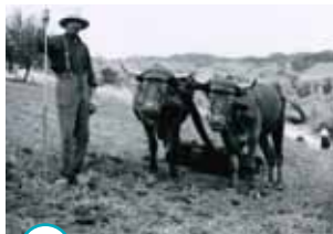
○ labourer la terre