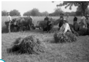
○ moissonner : couper et attacher les gerbes de blé