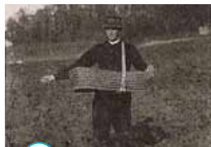
○ semer le blé

Toutes les personnes âgées n'étaient pas d'une famille d'agriculteurs, mais toutes ont aidé les voisins pour la moisson ou la fenaison (récolte du foin). Les enfants ramassaient les grains après le battage, apportaient aux hommes de quoi boire tout au long de la journée.