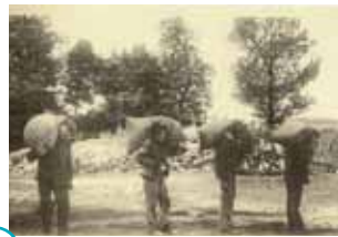
○ ranger les sacs de grains