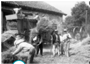
○ battre le blé